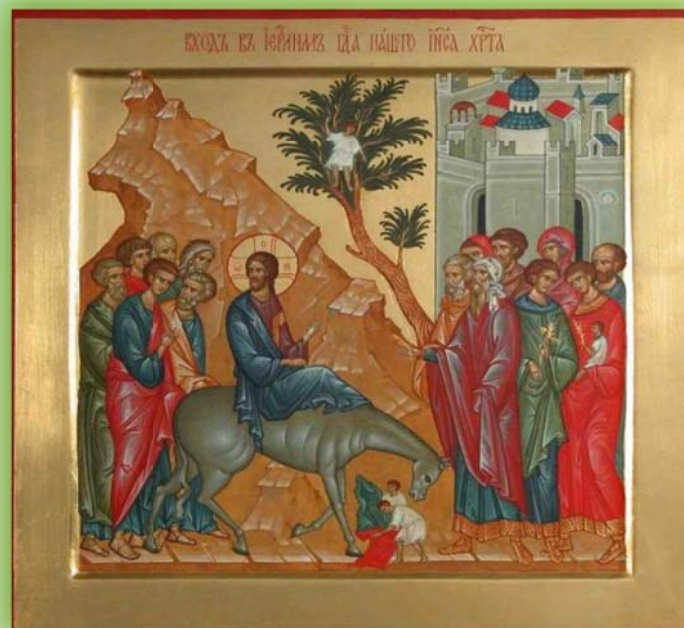
Вход Господень в Иерусалим или праздник вайи, Вербное воскресенье. Икона