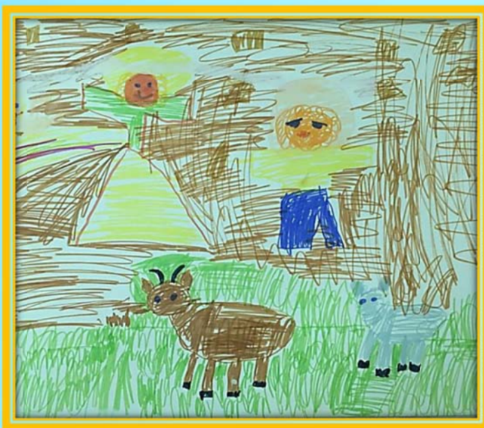
Сергеева Катя, 5 лет. Первые люди, Адам и Ева