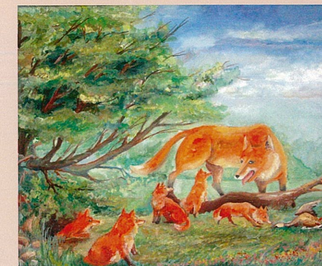
Дубовик Настя, 14 лет