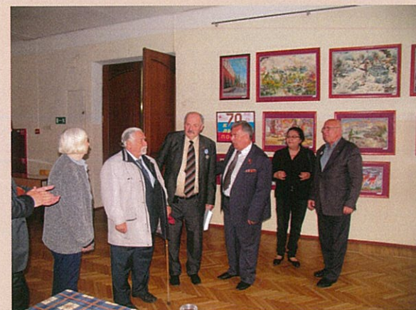
Выставка детских работ в помещении Российского нового университета во время работы XII съезда «Всемирного Всеславянского Собора»

В рамках воспитания любви к Родине, преемственности поколений, изучения её многовековой истории и подвига Советского народа в Великой Отечественной войне, все учащиеся изостудии «Радуга» выполняли работы на различные сюжеты о войне. Ребятам такие темы важны, так как, проживая и пропуская через себя, то, что им рассказывают бабушки и дедушки, то, что они читают в книгах и смотрят на телеэкранах о войне, а также реальные встречи с ветеранами в изостудии, все это дает им возможность более правдоподобно и качественно выполнить работы.