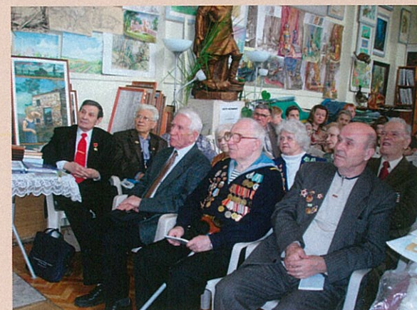
В гостях у изостудии "Радуга" ветераны Великой Отечественной войны накануне Дня Победы