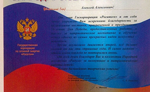
Благодарственное письмо за выставку детских работ в Российской Государственной корпорации «Росатом»